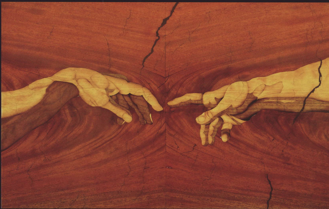
il contatto / コンタクト Materiale : mogano, betulla, noce / 素材 : マホガニー、バーチ材、ウォールナット Size : 57 x 36 cm