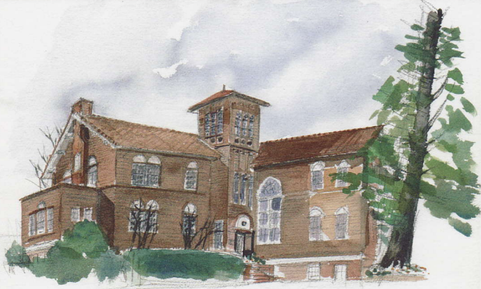
早稲田スコットホール / Sketch by Kiichi Suzuki