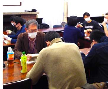
2020年2月26日(水) 休会になる直前の学習風景